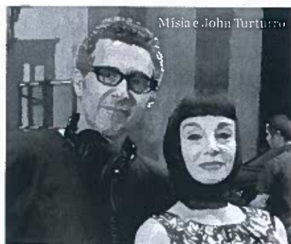
Mísia e John Turturro

A cantora Mísia lançou o seu novo album, 'Senhora da Noite', no passado mês de Novembro. O disco já tinha sido apresentado ao público há um ano atrás. No próximo dia 31 de Janeiro, Mísia estará presente no palco do Bataclan em Paris. Encontro com esta cantora fora do comum.